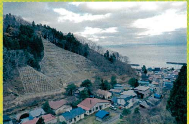
【令和3年度写真コンクール最優秀賞】 「集落を守る治山事業」 北海道函館市 山本竜太郎